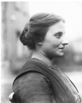
Elsa Gindler (1885 – 1961) mit Gerburg Fuchs